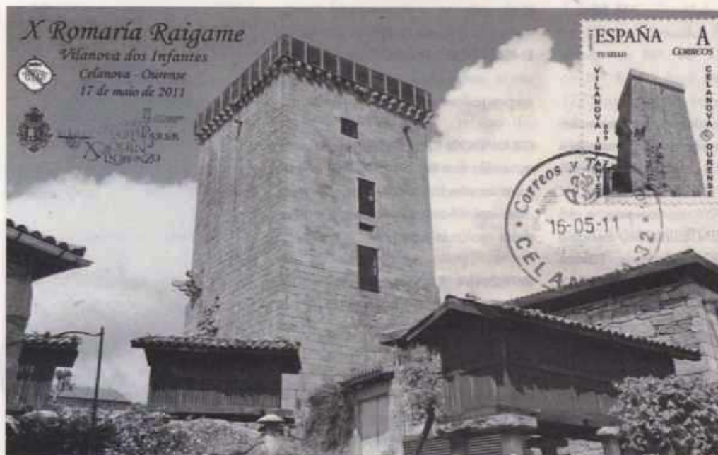
Torre de Vilanova

Data de solicitude: 26/4/2011 Data de aprobación: 27/4/2011 Data de presentación: 17/5/2011