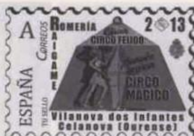
Circo Feijoo Data de presentación: 17/5/2013

Outra rama dos Feijoo é a que deriva da irmá de Secundino, Blasinda que casou en Vilanova con