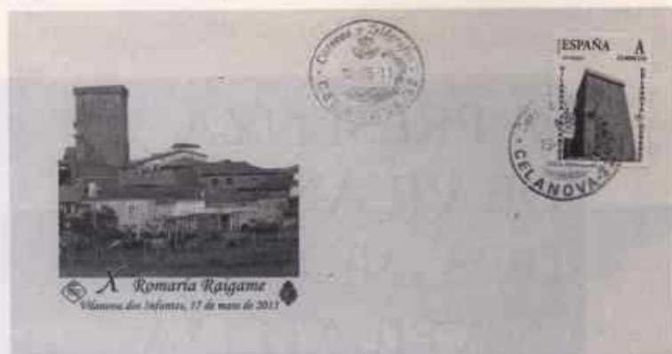
Sobre ilustrado e tarxeta máxima conmemorativas