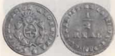
Nº 12: 1/2 Real de 1854 de La Rioja provincia Argentina