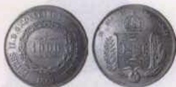
Nº 4: 1000 REIS de 1860 de Brasil