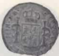
Nº 16: 1 Real de Carlos III de Potosí de 1774 e J.R. ensaiador