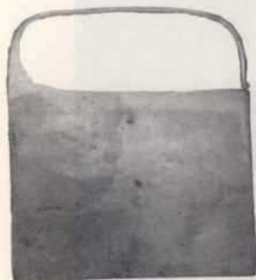
B: Upull recoñecido pola súa forma cadrada simple, sen gravados cun arco que vai de extremo a extremo na súa parte superior para o seu soporte