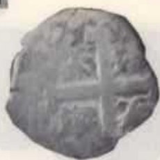
Nº 17: 2 reales macuquina de 1739 de Potosí