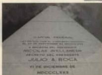
A fachada oeste do Obelisco de Bos Aires lembra o acontecemento

A que aparece no cadro corresponde coa de cobre xa que as de prata e ouro levan a lenda do anverso en números romanos "VI DE DICIEMBRE DE MDCCCLXXX"