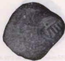
Nº 7: VIII Maravedis de vellón co resello de 1641 de Felipe IV

En plena guerra con Chile don Nicolás de Piérola, que se fixera co poder o 23 de decembro de 1879 tras dar un golpe de estado, cambiou o sistema monetario de Perú ao patrón ouro. Adoptouse