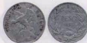
Nº 3: 1 Peso de 1895 de Chile