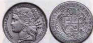
Nº 18: 1 Peseta de Lima de 1880 "Mañona"