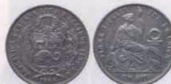
Nº 21: 1 Sol de 1866 de Lima