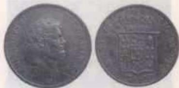
Nº 1: 120 GRANA de Nápoles de 1854