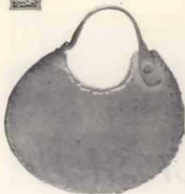
A: Chaway de forma discal representativo de Kuyen (Lúa)