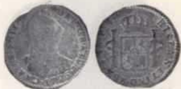
Nº 8: 1 Real de Carlos III de Potosí de 1776 e P.R. ensaiador