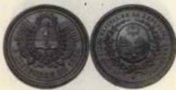
A: Medalla 1880 proclamación de Bos Aires como capital de Argentina