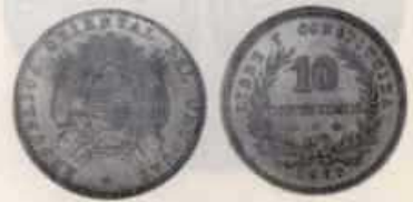
Nº 13: 10 Centésimos de 1877 de Uruguai

un sistema baseado no "Inca de Ouro", pero a medida non puido ter efecto pois o desenrolo da guerra impediu a acuñación de moedas nese metal. Són logran imprimirse billetes expresados en "Incas" e acuñarse moedas de prata fraccionarias, como a de 5 pesetas, e outra de unha peseta chamadas "Moñonas" pola representación do busto.