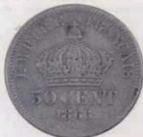
Nº 14: 50 céntimos de 1866 de Napoleón III coa cabeza laureada