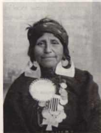
Muller Mapuche fotografada en 1890.