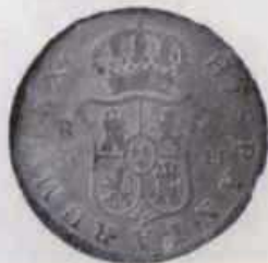
Nº 19: 2 reales de Carlos III de 1775 da Ceca de Madrid simbolizada polo M coronado do reverso